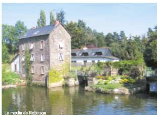
Le moulin de Robinson

La vie culturelle de la commune connaît plusieurs temps forts, avec le Grand Prix de Peinture de la ville en novembre et le "Festival Robinson, l'art les pieds dans l'eau" en juin. Saint-Grégoire compte près de 80 associations, qui mobilisent près de la moitié de la population grégorienne, participant ainsi activement au dynamisme de la commune. La ville est également jumelée avec Uttenreuth (Allemagne) et Holywell (Pays de Galles).