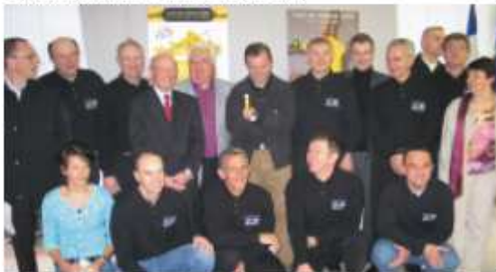
Le Maire, deux de ses adjoints, les agents communaux et les membres de l'association Les Amis du Vélo se sont réunis tout au long de l'année pour mettre sur pied le départ de la 7 ème étape du Tour de France 2006.

À la suite de l'annonce du passage de la Grande Boucle à Saint-Grégoire en octobre 2005, un groupe de travail s'est constitué pour l'organisation du Tour à l'échelle de la commune : le circuit et les aménagements afférents, les infrastructures, la sécurité, les animations, la communication autour du départ du premier contre-la montre individuel... Rien n'a été laissé au hasard.