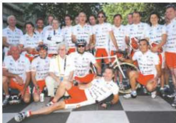
L'équipe de l'Etape du Cœur 2005