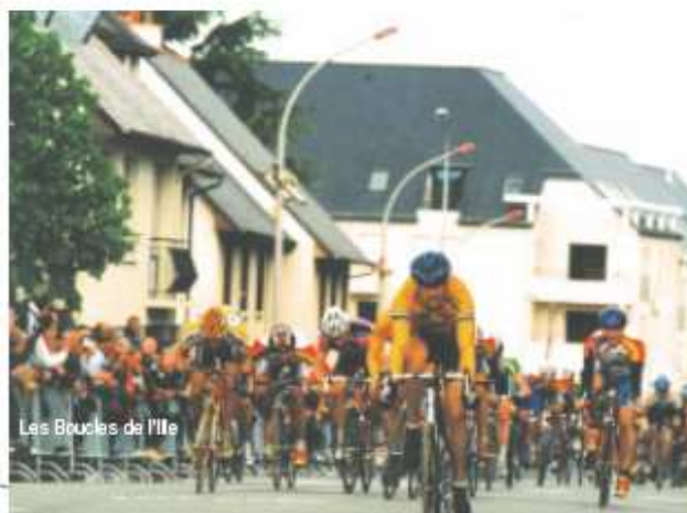
Les Boucles de l'Ille