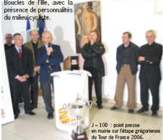
J - 100 : point presse en mairie sur l'étape grégorienne du Tour de France 2006.

Les bâtiments communaux ont arboré le visuel officiel du Tour 2006 dès le mois de décembre 2005. Un logotype original et dynamique a été accolé au logo de la ville pour accompagner la montée en puissance de l'événement 2006. Des fleurs jaunes égaient désormais tous les parterres de la commune. La mairie a vécu au rythme des réunions sur le thème du Tour pendant 6 mois. Des rendez-vous avec la presse locale ont été organisés pour diffuser les informations inhérentes à l'organisation du passage du Tour à Saint-Grégoire. Comme le point presse qui a eu lieu le 1 er avril (à J-100), à l'occasion de la présentation de la 18 ème édition des Boucles de l'Ille, avec la présence de personnalités du milieu cycliste.