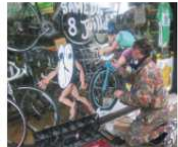
Le dessinateur Teddy Botrel a apporté sa touche d'humour aux vitrines des magasins du centre commercial de La Forge.

Une large concertation a également été menée auprès des associations , des écoles , des commerçants et des entreprises locales pour que l'ensemble des forces vives de la ville soit associé à l'organisation de cet événement.